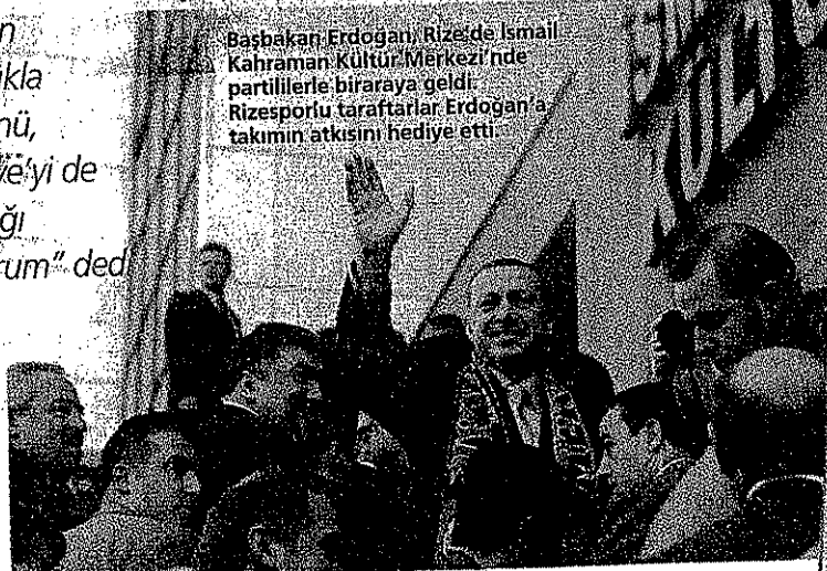
Başbakan Erdoğan, Rize'de İsmail Kahraman Kültür Merkezi'nde partililerle bir araya geldi. Rizesporlu taraftarlar Erdoğan'a takimin atkısını hediye etti.

Erdoğan, önceki gece memleketi Rize'nin Güneysu ilçesindeki evinde kaldı. Rize Valiliğinin düzenlediği ve işadamları ile sivil toplum örgütleri temsilcilerinin yer aldığı yemeğe katılan Erdoğan, son altı yılda Türkiye'de siyasetin kalitesinin ciddi ölçüde yükseldiğini savunarak, "Siyasetin kalitesini düşük düzeyde tutmak iste-