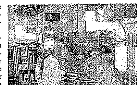
Robotun maliyeti 2 milyon 500 bin YTL.

Güneş, tıp dünyasının daha az eğri, daha küçük yara izi ve çabuk iyileşme imkanlarını hastalara sunmak için büyük uğraşlar verdiğini ve