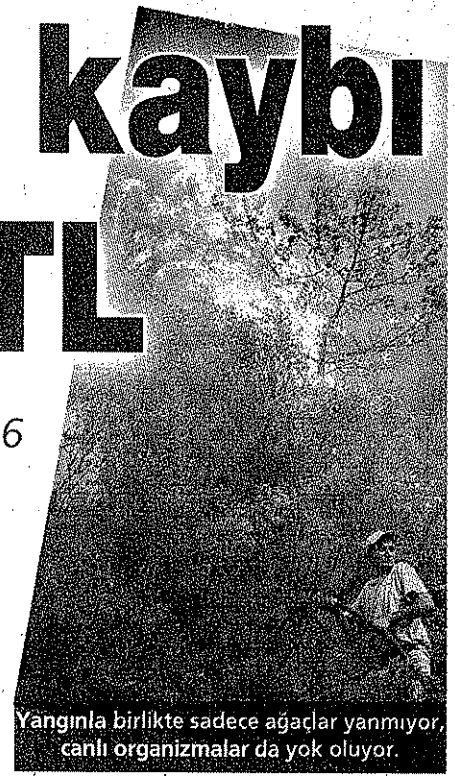
Yangınla birlikte sadece ağaçlar yanmıyor, canlı organizmalar da yok oluyor.

TEMA'nın çalışmasına göre, Türkiye'de, en riskli bölge Akdeniz ve Ege sahillerinden İstanbul'a kadar uzanan kıyı bandı. Ormanların yüzde 58'i, 12 milyon